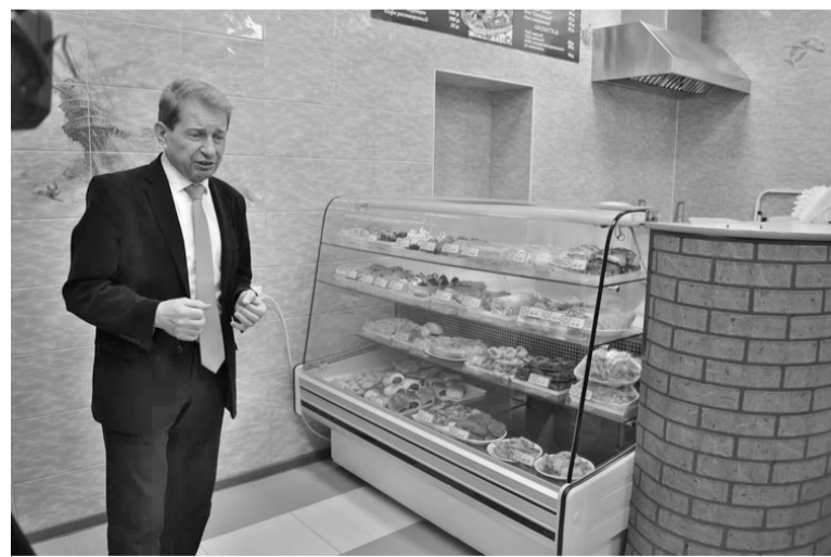
Гастрономическое путешествие от БЗПП.